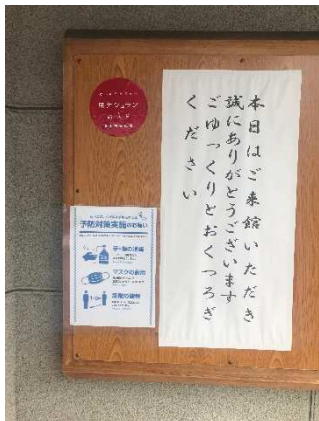
玄関のお客様へのお願い